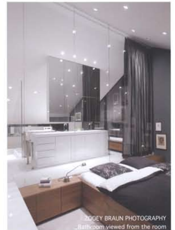
_Bathroom viewed from the room