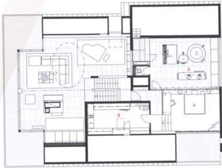
2nd Floor plan