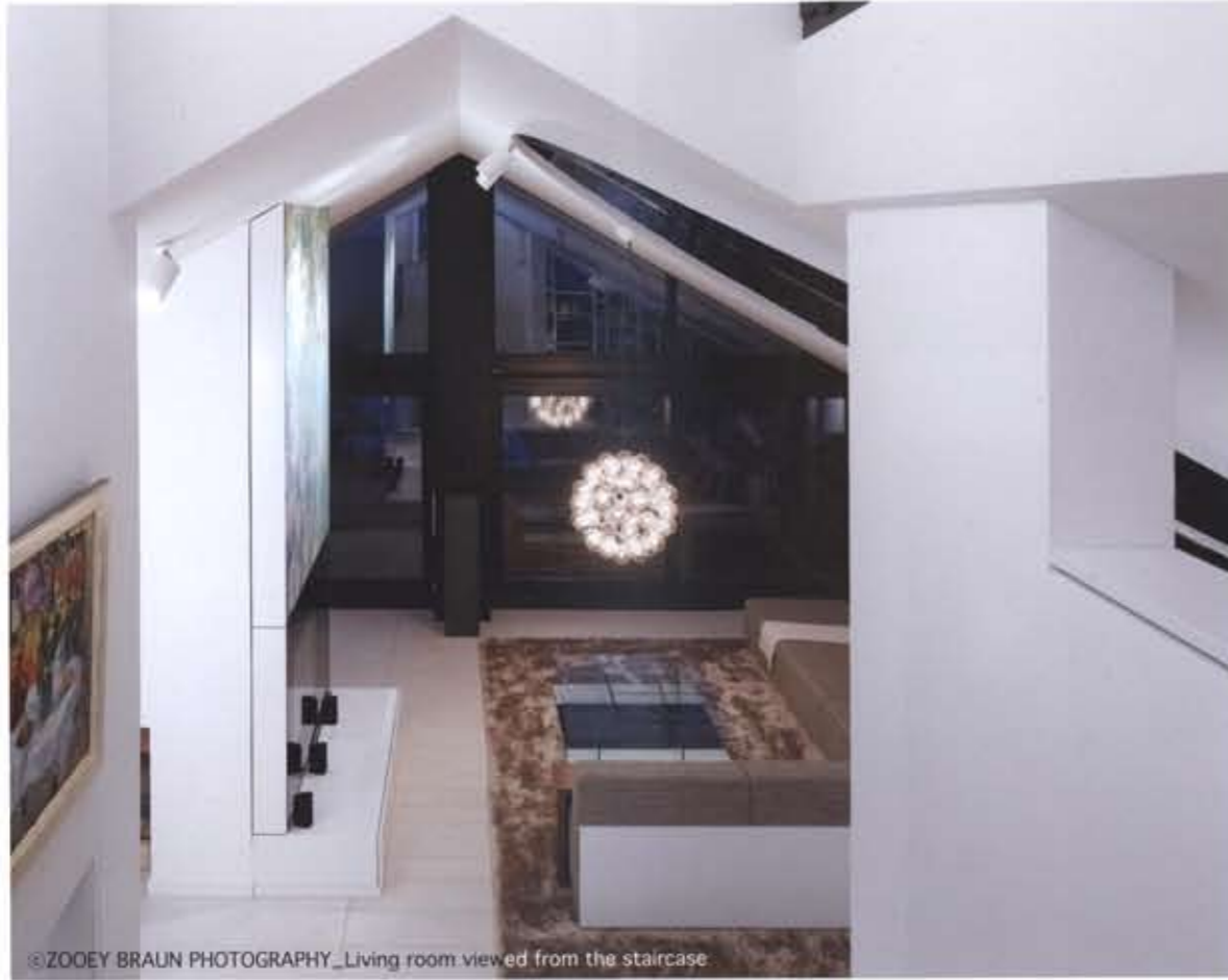
Living room viewed from the staircase

아파트 Sch는 세련된 주거 환경을 추구하는 고객의 욕구를 충족할 뿐만 아니라 고객이 소유한 방대한 미술 소장품을 보관하고 전시하기에 적합한 공간을 제공하고 있다.