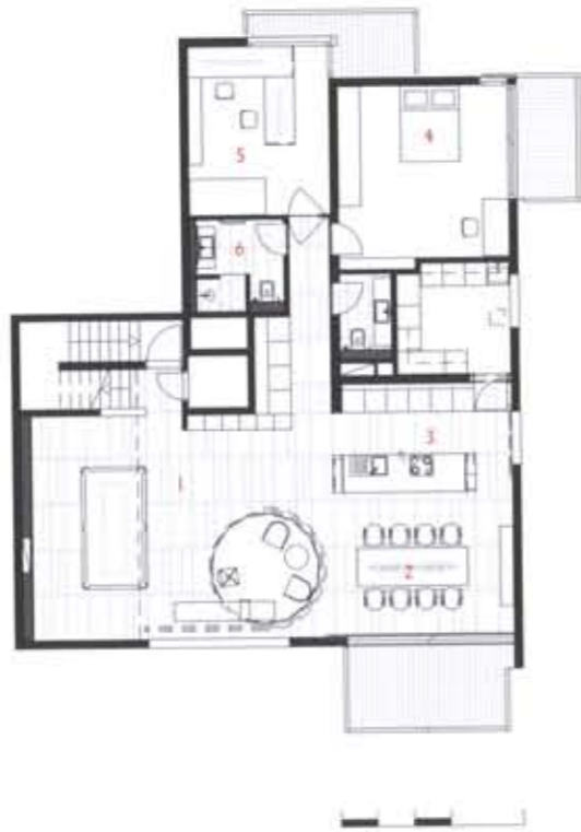
1st Floor plan