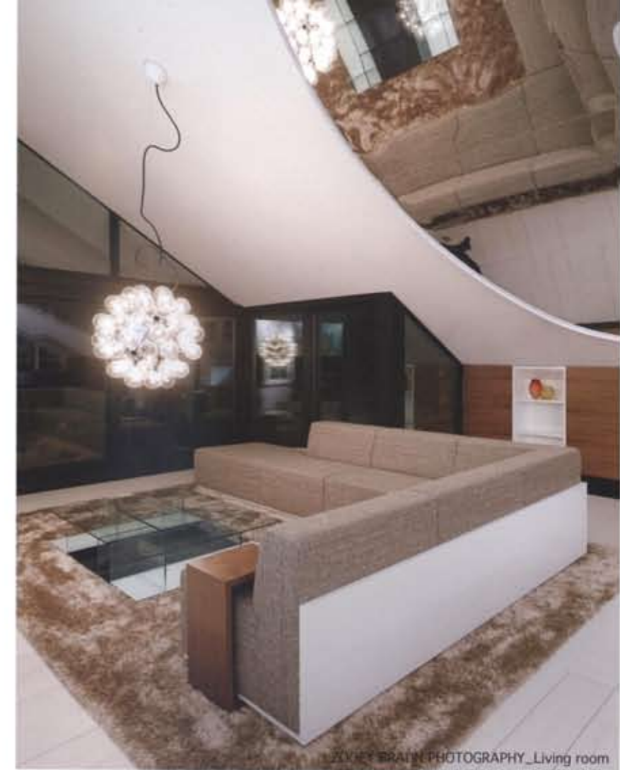
ZOOEY BRAUN PHOTOGRAPHY_Living room

Sch 아파트 공간의 모든 것은 미술품과 조망을 중심으로 설계되었다. 멋진 파노라마 경관과 함께 미술 소장품이 곳곳에서 공간의 재료, 기하학적 형태, 색상등의 요소와 어우러져 인상적인 상호 작용을 한다.