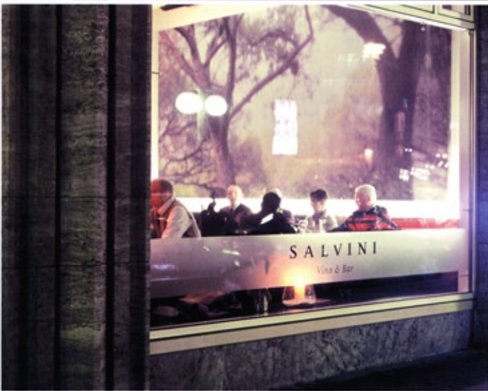
窓越しに店内を見る The inside of a store is seen from the window

With taking over the restaurant Salvini the new proprietor wished to realise an old dream of his : an urban downtown location, less restaurant than easy-spirited meeting place for the friends of Italian life-style. Contrasting with suspense the rather purist and minimalistic atmosphere of the interior, without dissolving the clarity of its space, large-format pictures of an Italian pinewood were hung. Urban activity and rural relaxation confront each other. The forest pictures give the remodeled restaurant sensibility and depth. They serve as a continuous, identity-creating and unique visual feature from the wall design, the table sets to the menu up to the internet presentation.