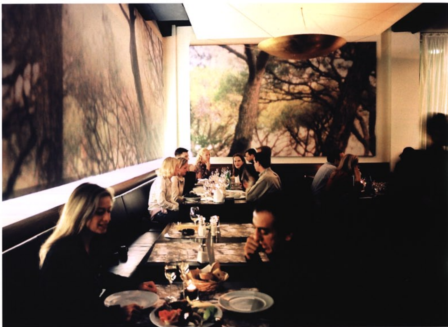
入り口左手の客席 Seat at the left of entrance