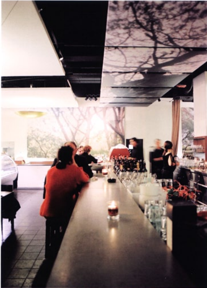
ドリンクカウンター Counter at center

レストラン「サルヴィニ」は、リニューアルに当たり、新オーナーの長年の夢だった案を汲んで、都会の繁華街に位置する、イタリアのライフスタイルのように、仲間が集まりやすい気のおけないレストランというコンセプトにすることとなった。透明感のある空間を維持しつつも、ビュアでミニマルなインテリアをざりざりまで対照させ、巨大なイタリア松の写真が掛けられた。都会的な活気と寛ぎ感をうまく拮抗させ、掲げられた木の写真はレストランに情緒的な雰囲気と深みを与えた。それらは今後も引き続いて店のアイデンティティを積み上げ、店舗に個性を持たせ、テーブルセットやメニューにいたるまで、そのデザイン・アイデンティティは広く採用されている。