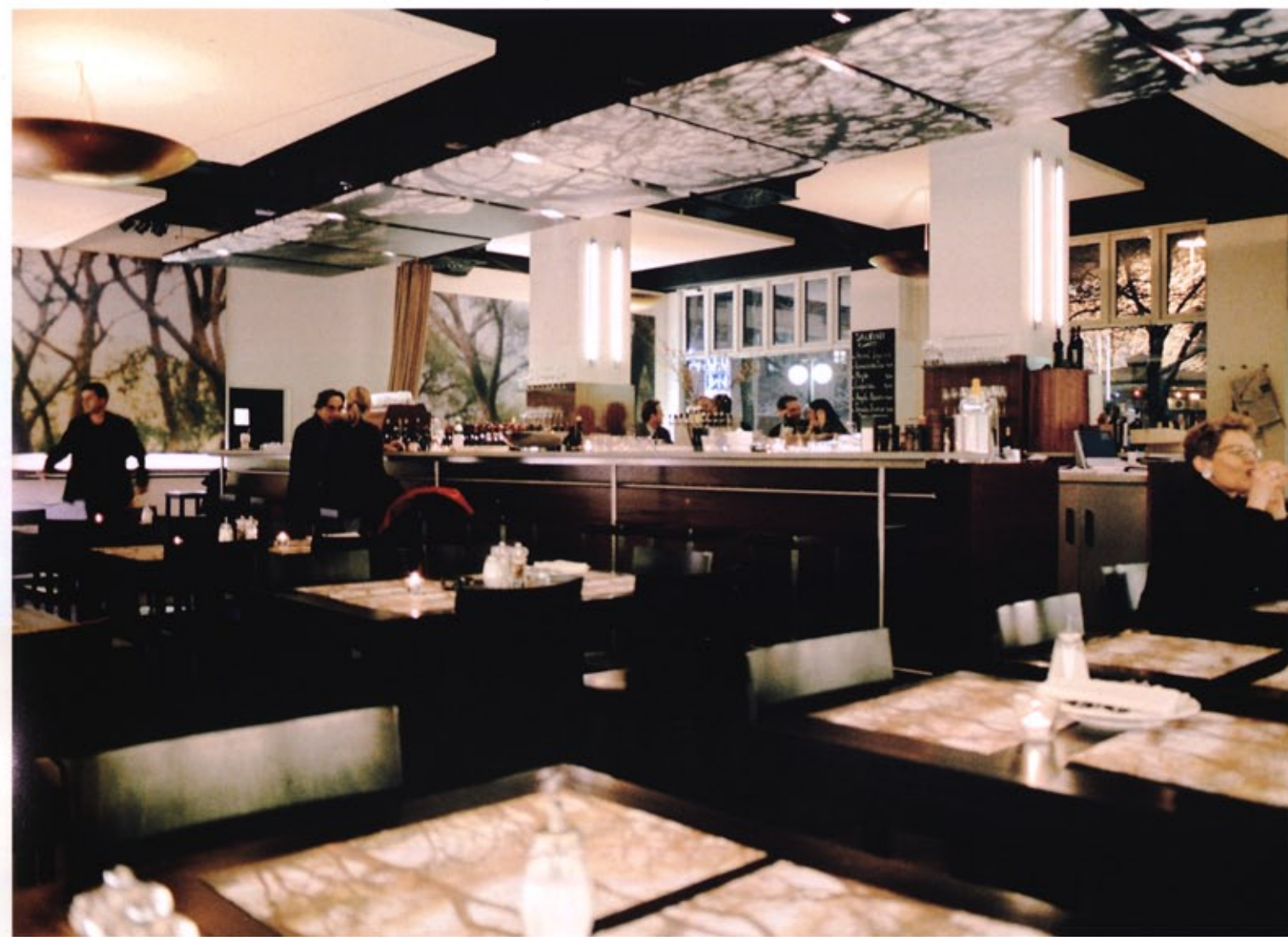
中央に設置されたドリンクカウンター Counter at center