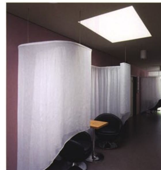
Die Flure werden durch Sitzinseln zu Kommunikationszonen The corridors are turned into communication zones through seating areas

The residential areas have been designed with the various needs of the residents in mind: private in the personal environment of their own room, communicative and participative in the armchairs of the homely design of the public areas, semi-private in the seating niches of the corridors or more active in the restaurant, the therapy areas and on the terrace in the open air. Along with the armchairs, the main corridor is dominated by a picture wall along its whole length. The memories from the life of the residents are collected in more than 170 picture frames, representing the individual and unique nature of each biography.