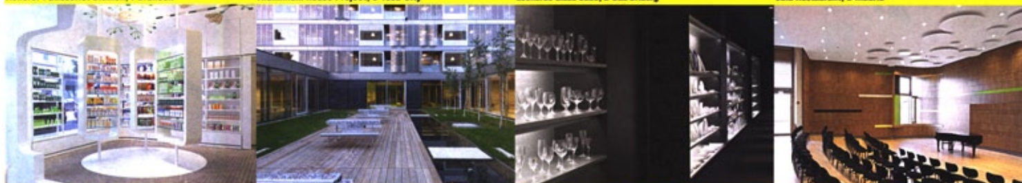
Linden Apotheke, D-Ludwigsburg