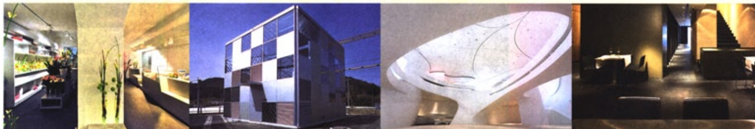
Acherer Patisserie. Blumen, I-Bruneck

Preise: jeweils 2.000 Euro. Für die Teilnehmer unter 40 Jahren, das heißt für zwei Sonderauszeichnungen der „New Generation“, standen der Jury 2.000 Euro zur Verfügung. 65 Projekte wurden in der Kategorie „New Generation“ eingereicht, allein 39 kamen aus dem Ausland. Um dem durchgehend sehr hohen Niveau der eingereichten Projekte gerecht zu werden, entschloss sich die Jury einstimmig dazu, wie im vergangenen Jahr die Preisträger auszuwählen und darüber hinaus in jeder Kategorie eine „Shortlist“ von fünf erwähnenswerten Projekten aufzustellen. So soll der Öffentlichkeit und allen Teilnehmern klargemacht werden, wie eng und qualitativ es an der Spitze zugeht.