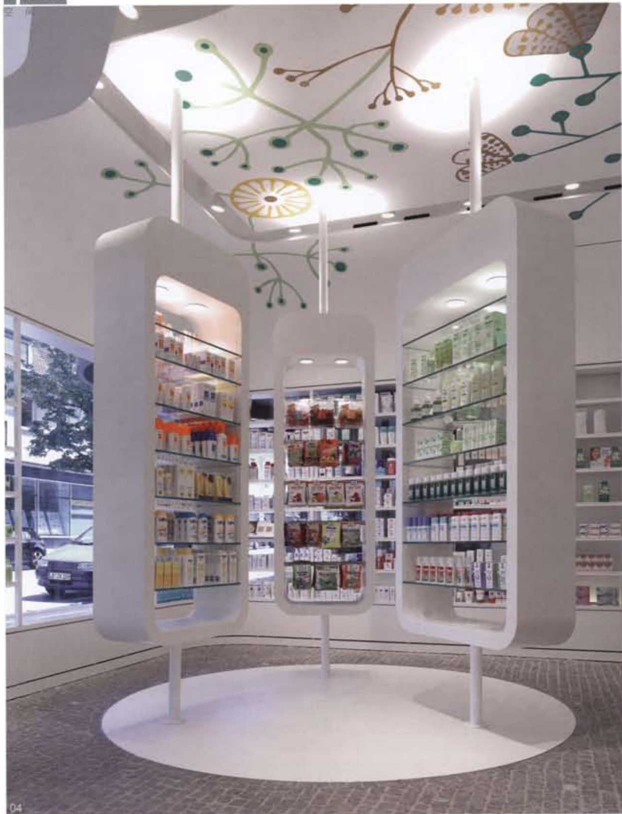
04 三个独立的陈列架的产生增加了空间的利用率,也合理分割了空间 05 纯白的白色墙面、连续精致的货架和墙面的弧线等这些元素组合在一起,赋予这里非凡的面貌 06 平面图