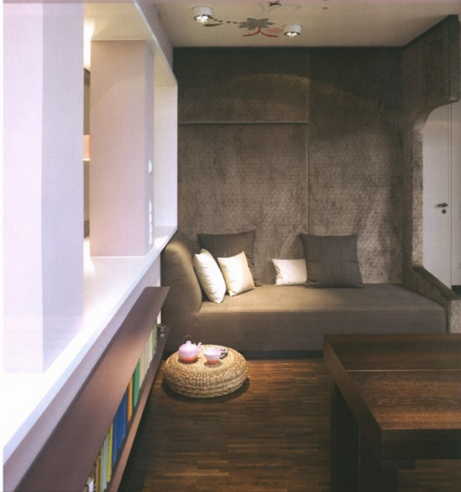
Texto :: Text - Alexandra Novo

— Perspectiva da zona de estar revestida a veludo e painel lateral pregado com pequenos diamantes. À esquerda, janela com vistas para a varanda e no tecto composição assinada pela artista Monica Trenkler.