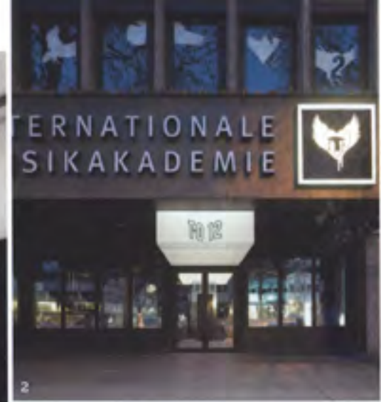
왼쪽 페이지 도심형 연상사키는 모던한 일러스트로 장식한 스타이지 1 블랙&화이트를 사용해 심플하면서도 세련되게 디자인한 T-O12 2 공공기관을 연상시키는 입구 3 테오도어 호이스 대통령을 경이하는 의미로 새겨 넣은 문구