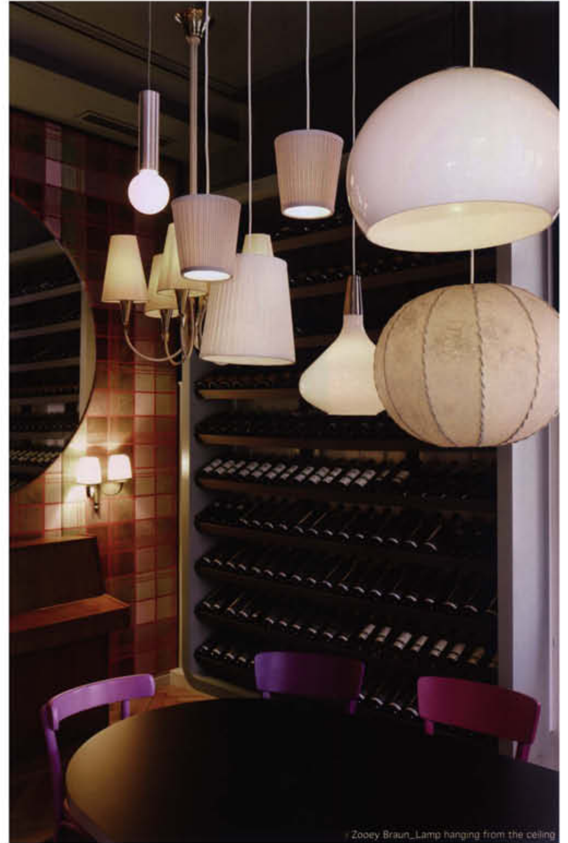
Zoey Braun_Lamp hanging from the ceiling

벨라 이탈리아 와이네는 레스토랑뿐만 아니라 술집을 겸업하고 있는 곳으로, 의뢰인은 모국인 이탈리아와 관련한 가정요리를 판매하며 새로운 음식문화를 독일에 전달하고 있다. 디자이너는 규모가 작은 공간에도 불구하고 레스토랑과 술집으로 함께 운영되는 특성을 동시에 표현하기 위해 친근한 느낌과 함께 개인성을 강조하려는 계획을 세웠다. 이에 현대적으로 디자인된 공간은 고객들이 장시간 머무르는 경우에도 한결같이 편안한 느낌을 전하고 있다. 공간은 두 부분으로 나뉘어 각각 다른 디자인을 선보이는데, 입구에 들어서자마자 먼저 접하게 되는 첫 번째 공간은 천장에 90개 이상의 거울들을 설치해 시선을 압도한다. 이것은 디자이너가 몇 년 전 여행지에서 봤던 모습을 적용한 것으로 궁전의 한 방이 오래된 거울로 꾸며진 아름다운 모습에 깊은 인상을 받았기 때문이다. 이에 그 기억을 되짚으며 이곳에 인용하고 새로우면서도 다양한 버전으로 적용시켰다. 여기에 사용된 거울의 대부분은 베희시장에서 구매할 수 있는 엔틱제품으로 전부 각각각색의 디자인을 지니고 있다. 거울이 다양성을 가진 만큼 특색이 다른 고객들 취향에 따라 마음에 드는 것을 고를 수 있게하여 황홀함을 전하며 이를 통해 의도했던 디자인에 근접하길 바랐다. 아울러 벽체에는 수납장을 설치해 수많은 와인들을 준비하게 놓아 맛있게 즐길 수 있었던 요소에 재미를 부여하였다. 룸으로 구성된 두 번째 공간은 벽에 직물을 덮고 타원형 테이블, 둥근 거울, 천장에서 거는 램프, 양탄자 등으로 집과 같은 안락함을 연출한다.