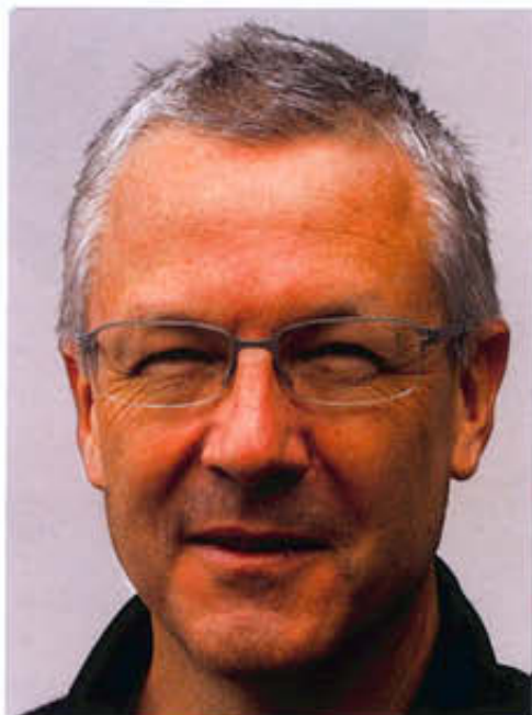
Валерио Олджати: «Мы стремились создать заметный ориентир, яркий визуальный образ, воплощающий собой знаковую роль PermMuseumX1». С. 100

Апрель дразнится, обманывает, смеется. Еще вчера мир утопал в сугробах, а сегодня уже улыбается первой зелени. В апреле он как никогда текуч, полон иллюзий и превращений. Весна навевала нам мысль об иллюзорности дизайна. Дизайнеры – люди любопытные. Жажда познания заставляет их снова и снова пытаться разгадать загадки мира, извлекать из тривиальных объектов, форм и цветов неочевидные смыслы. Невозможные фигуры, непривычный взгляд на фактуры и материалы – хорошее подспорье в деле создания иллюзий. И все же, за каждой иллюзией стоит нечто конкретное, рациональное и механистичное. Всякий дизайнерский объект – это, прежде всего, материалы и формы. Остальное – работа воображения. А на какие иллюзии способны вы?