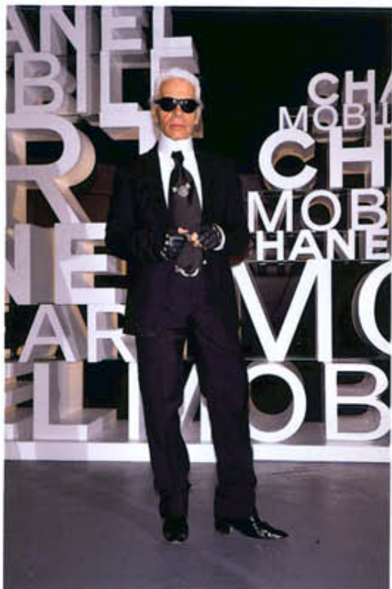
Карл Лагерфельд: «Chanel Mobil Art - уникальное арт-действие. Это настоящий 21 век, настоящий музей Chanel». С. 20