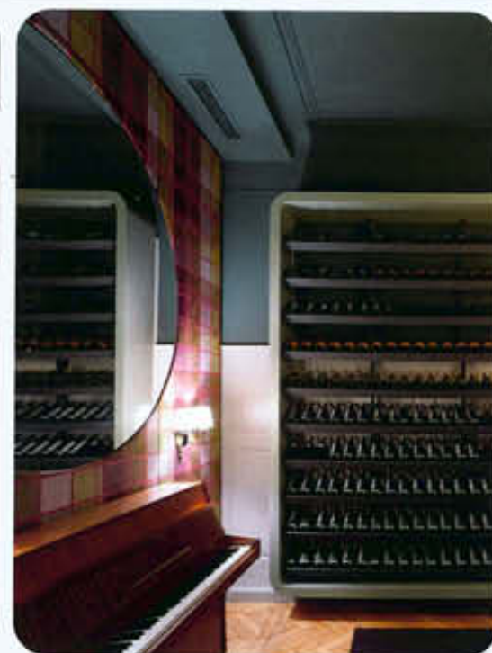
Слева направо: Зал ресторана Bella Italia. Стеллами с бутылками вина – неплохая альтернатива традиционным способам отделки и украшения. Стекло свет эффе́тно играет в темно-зеленом стекле бутылок, и нарядным и ярким этикеткам хочется прикоснуться. «Мини-гостиная» ресторана. Фрагмент 1, 2 и 3. В качестве декорацио́нных элементов использованы круглые зеркала, ковер и множество фонариков, подвешенных к потолку.