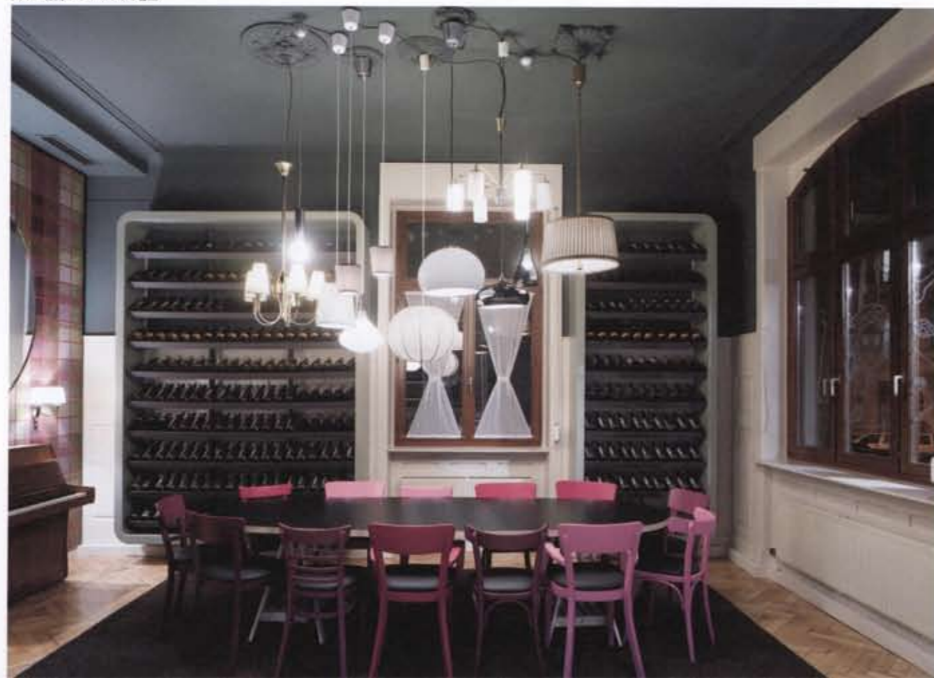
入り口右側のピアノのある客席

「Bella Italia」はワインを販売する店舗兼レストランである。独立した複合住居の1階にある。特徴となるのは、2つのエレメントである。第一に、天井に90ものさまざまなミラーがランダムに取り付けられている。第二に、大きな楕円形のテーブル、壁面の大きな丸い鏡とテキスタイルのカバー、カーペット、天井から吊り下げられた照明などによって、空間が居心地の良い居室のような雰囲気になっている。三つの大きな柱も、商品陳列に効果的である。「ベラ・イタリア・ワイン」の企業イメージにふさわしいコーポレートデザインとなっている。