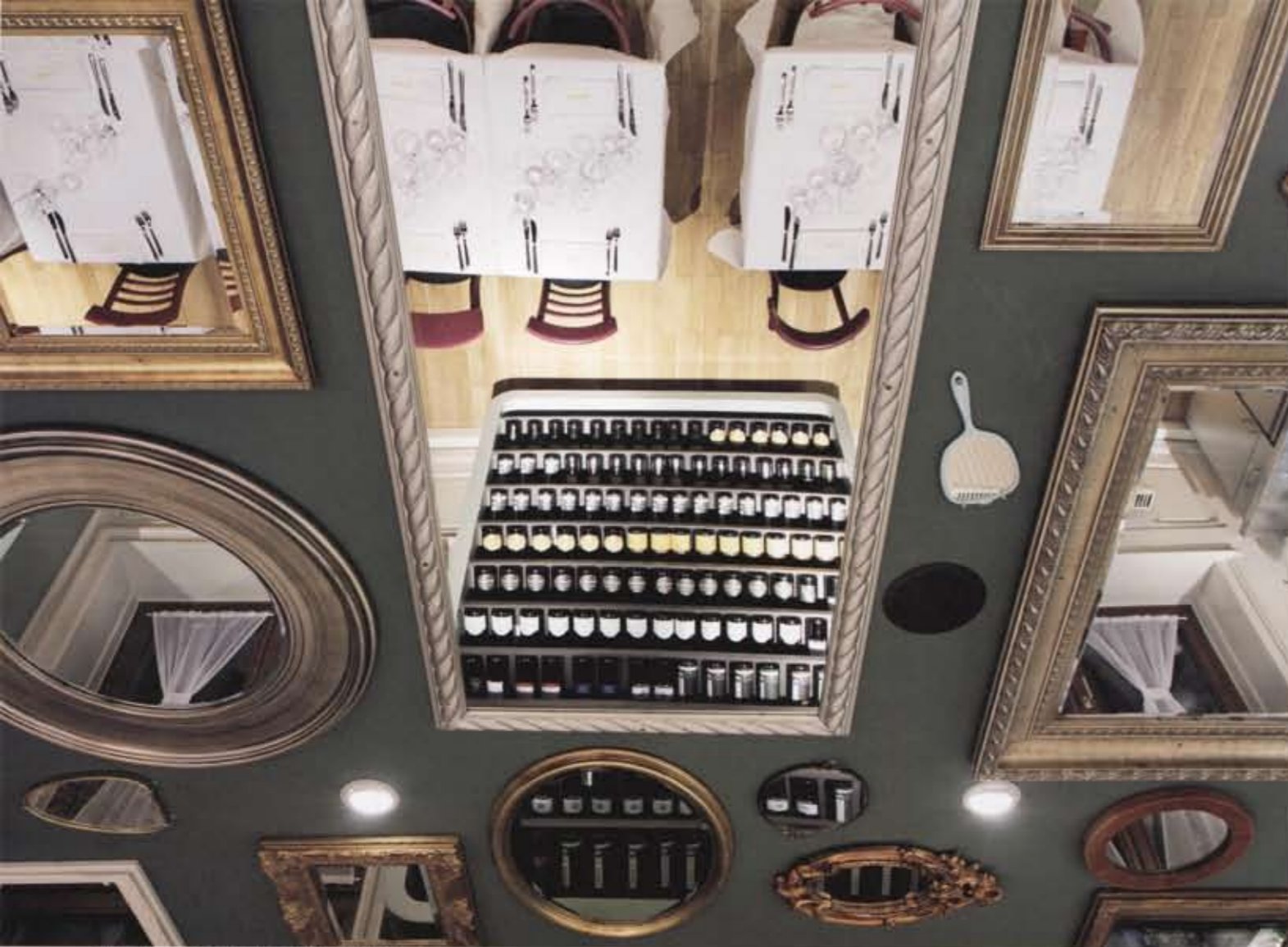
さまざまなミラーがランダムに貼られた天井を見上げる