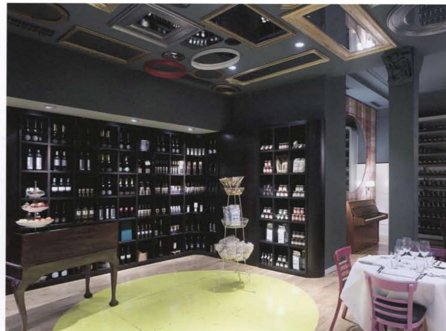
店内奥のワインがディスプレイされたコーナーを見る