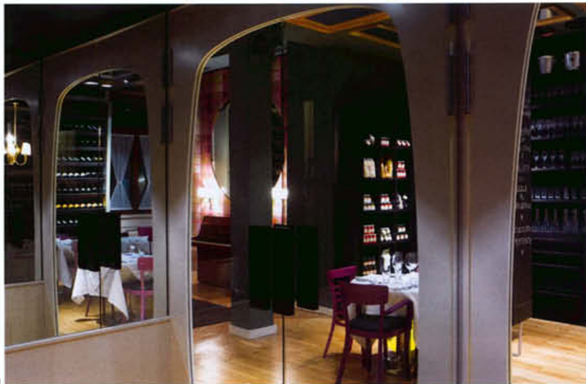
1 Ippolito en Fleitz werken met elementen die in een chique restaurant nauwelijks zijn te vinden, maar een knusse en persoonlijke sfeer creëren. 2 Vintage spiegels, door de architecten op vlooiemarkten verzameld, domineren het restaurant annex wijnwinkel Bella Italia in Stuttgart.

Wie Bella Italia Weine betreedt, krijgt het idee een sprookjesboek te hebben opengeslagen. De roze stoelen en het lampenwoud boven de ovale tafel wekken kinderlijke genoegens op. Tweedehands spiegels aan het plafond maken het mogelijk de andere bezoekers vanuit een vreemd perspectief te bezien. De architecten hadden de opgave om de bijeengezochte snuisterijen zo te ordenen dat de gezelligheid niet verzandt in chaos. Claudia Hildner