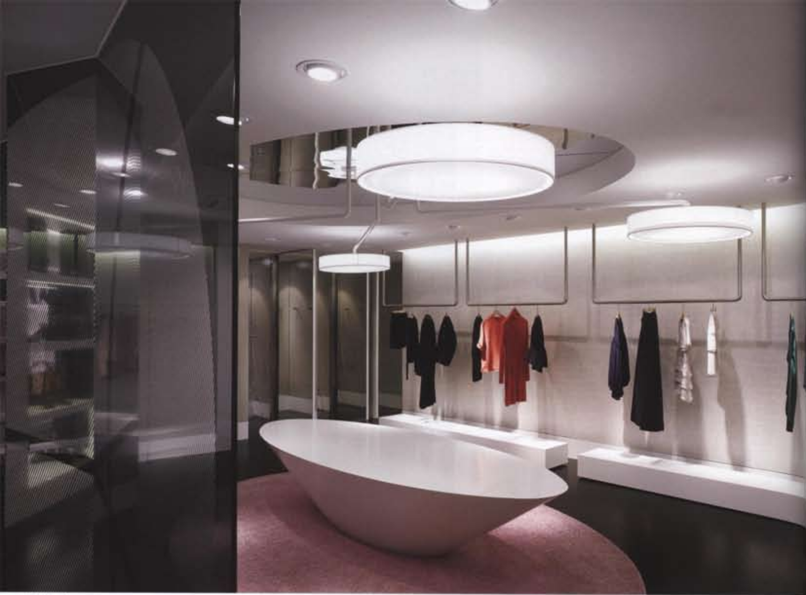
Fashion line zone