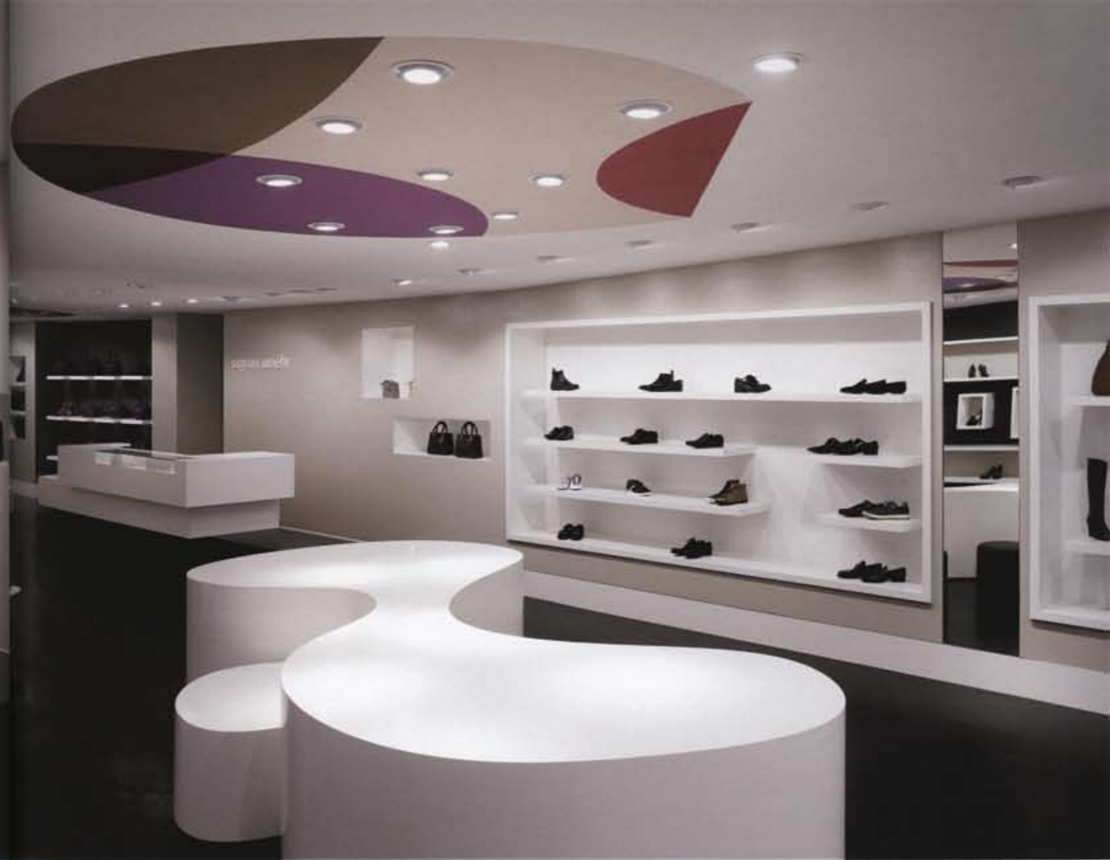
General display area

Sigrun Woehr is the premier address for high-end footwear in the state of Baden-Württemberg. This second shop marks a new departure for Sigrun Woehr as she expands her range to include a new line of fashion and accessories. The new store was to be housed in a shop space in the city center, which has a narrow floor plan stretching back almost 25m into the building. Our task was to create a spatial situation in which to present an exclusive range of goods, while at the same time enticing customers across the threshold. The ceiling of the space was specially designed to make a strong initial impact.