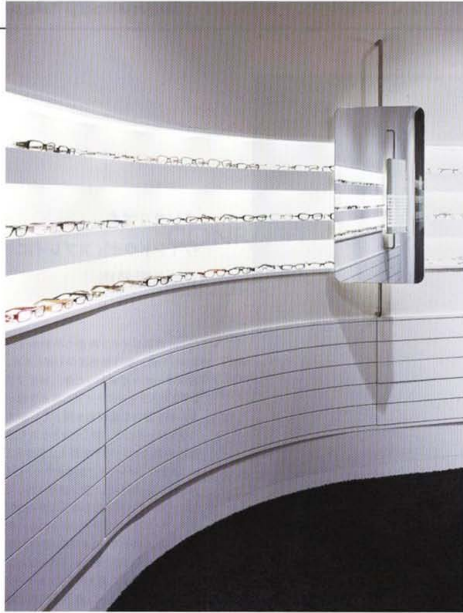
Shop interior becomes the window display

Conradt Optik resides in the pedestrian district of Mosbach, in southern Germany. With new owners, the shop wanted to differentiate itself from the competition by focusing on select brands and customer care. Long windows placed into the new façade allow maximum insight into the interior, which in itself becomes the window display. The shop opens onto the pedestrian district on two sides, and both entrances lead towards the centrally-located service counter. The rear wall merges seamlessly with the ceiling, and the recessed ceiling is decorated with fine lines in tones of brown, mauve, and blue. The room is enveloped by a white, curved rear wall, adding dynamism to the space. It conceals existing fixtures and connects to the ceiling via a wide-radius cavetto. Its soft contours formulate the wide-open horizon of the space, while at the same time dividing it into zones for women's, men's and children's glasses. The merchandise is displayed in three, recessed horizontal bays, with storage space located below. Customer service takes place at two islands at each end of the store. The entire shop space is fitted with a deep-pile, anthracite-colored carpet. This ensures good acoustics while enhancing the soft and flowing character of the interior. (Yasuhiko Taguchi)