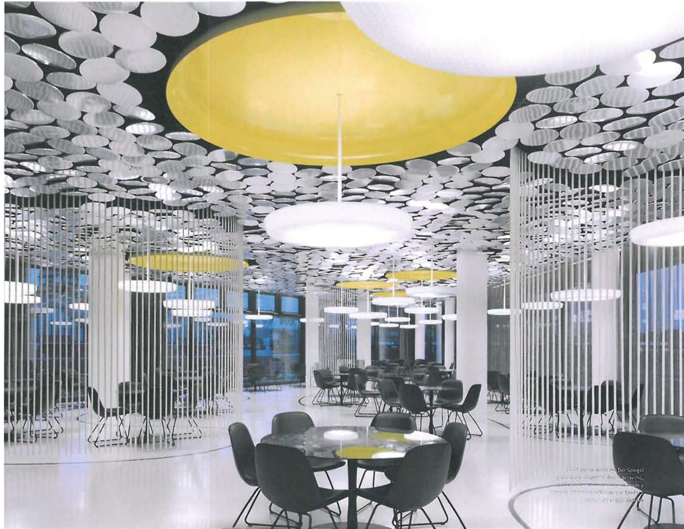
La cantina del semanario Der Spiegel actualiza el concepto de comedor del personal, basado en el confort y la gestión eficiente. El espacio interactúa con la cambiante luz natural, y con las reflexiones del agua circundante.

Dado que el comedor debía ser flexible, se decidió que el techo sería el elemento que definiría su diseño. Cubierto con 4.300 discos de aluminio pulido, inclinados en diversos ángulos, actúan como reflectores de la luz diurna al tiempo que absorben el ruido, y, en las horas nocturnas, reflejan tanto la iluminación general como la puntual. Esto significa que el ambiente de la cantina reacciona a su entorno. Durante el día, el techo está animado por los efectos del agua y la luz de los alrededores. Por la noche, los grandes platos se transforman en objetos luminosos gracias a la luz indirecta derramada por una selección de 35 luminarias suspendidas y fabricadas a medida que apoyan la estructuración del gran espacio.