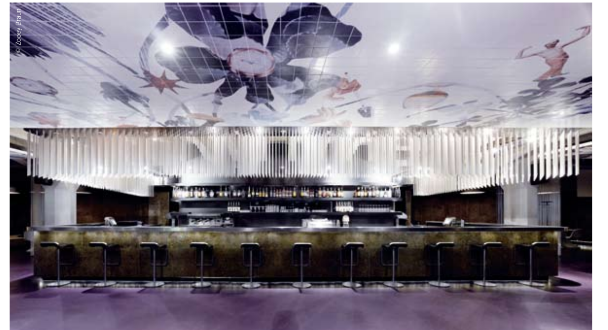
The bar decorated 2,500 plastic batons