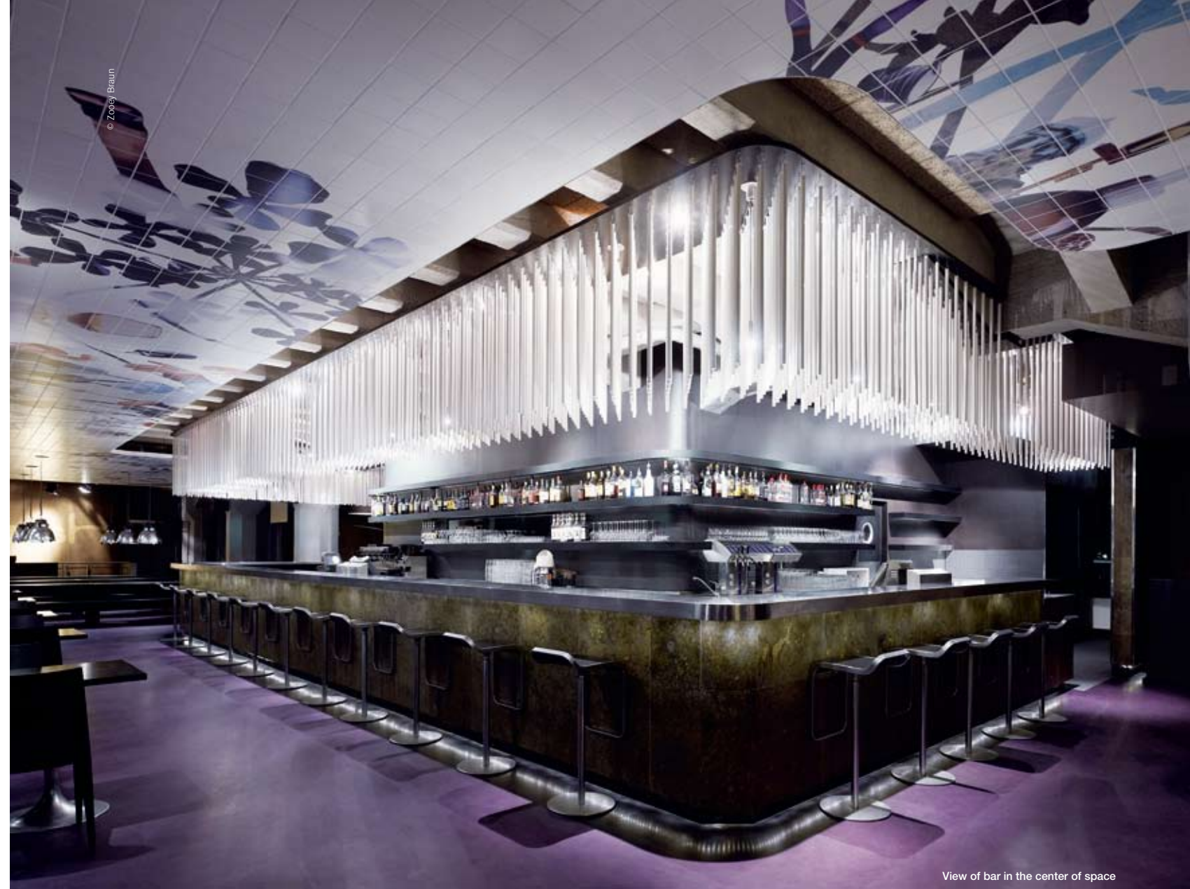
View of bar in the center of space

슈투트가르트에 보쉬가 들어서 있던 곳에 위치한 <매쉬> 맥주 양조장은, 오랫동안 유명한 파티장소로 이용되어 왔다. 현재 <매쉬>는 낮에는 카페로 이용되고 점심과 저녁에는 레스토랑으로, 밤에는 클럽으로 운영된다. 이렇게 공간은 성격을 달리하여 이용되기 때문에, 공간에 대한 요구 사항들은 아주 특수하면서도 이색적이다. 바 공간은 중앙 무대 쪽으로 옮겨졌고, 이 바로 인해 생긴 측면의 긴 공간은 명확하게 구별되는 세 곳의 영역으로 구획된다. 이 영역들은 각각 개별적으로 사용될 수 있으며, 이벤트의 종류나 규모에 따라 자유자재로 다시 디자인되고 그 크기도 임의로 조절된다. 공간 내에 매달려 있는 2,500개의 플라스틱 막대기는 묘한 분위기를 발산하며 빛을 사로잡고 조율하는 역할을 한다. 개별 영역들은 연속된 연보라색 바닥을 통해 서로 연결되며, 이 바닥은 산업건축의 나열된 공간과는 현격한 대조를 이룬다. 공간의 특성을 나타내는 핵심적 요소는 인쇄된 타일이 매달린 천장 장식이다. 이것은 공간을 한 번 더 순서대로 모으는 역할을 하며, 기존 건축 위에 부가된 커를 형성한다. 또한 타일 자체는 부엌의 분위기나 이전의 양조장 느낌을 불러일으킨다. 타일의 흰색은 보조적으로 간접 조명의 기능을 하며, 타일의 무늬는 슈투트가르트 예술가인 모니카 트랜클러가 초 현실주의적인 콜라주로 디자인한 것이다. 글 : 이폴리토 플라이트 그룹