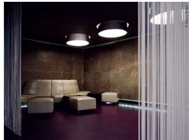
View of the lounge