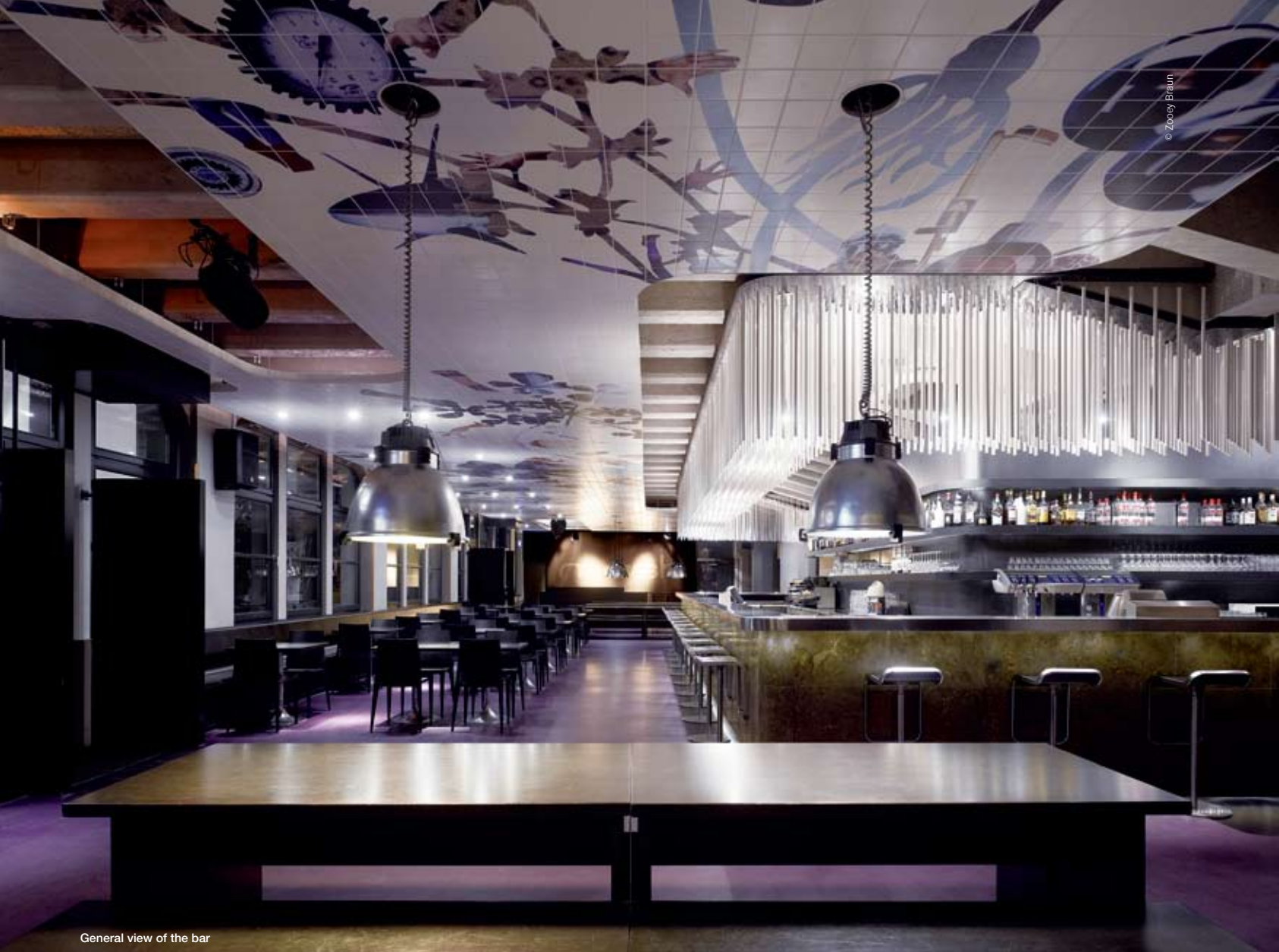
General view of the bar