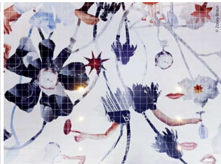
Pattern on the ceiling