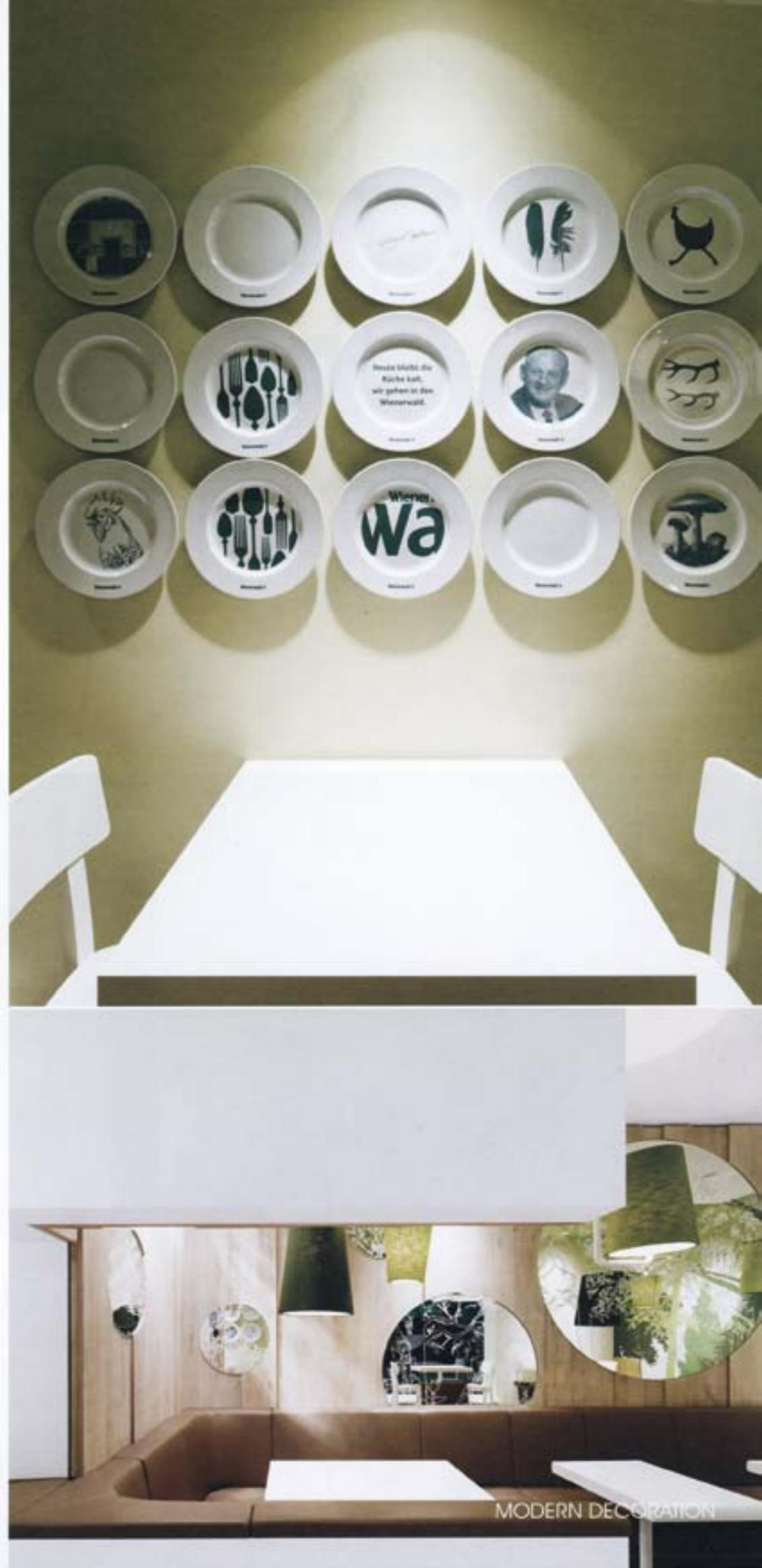
4 | 5 | 图4、5 维也纳森林固有的壁龛式座位格局 6 | 6 | 图5 墙面装饰传达着品牌历史

为迎合顾客不同用餐需求,用餐区提供了多种座位选择。白色的高吧台满足了那些稍有空闲的顾客的需求。这些高吧台由单腿支撑,落脚处设计为一个尖细的圆柱体,有几分传统翻转桌腿的意味。此外,在其对面还有一个拉长的座位区可供选择,设计师以棕色的人造皮革包裹座位,反映了维也纳森林固有的壁龛式座位格局。在这里用餐,顾客犹如被神秘地带入维也纳森林中。后墙以相互重叠的粗锯橡木覆盖,呼应了餐厅的森林主题。墙面