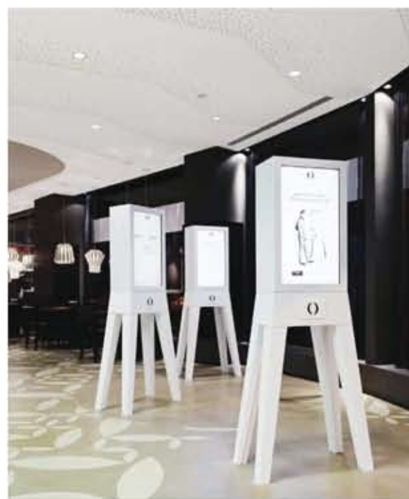
Breite Straße 1 Düsseldorf Germany www.holyfields.de

גרמניה. רשת מסעדות עם מערכת הזמנה במסכי מגע.