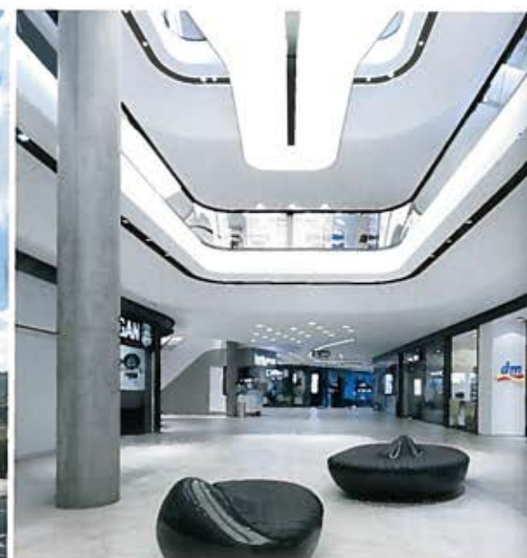
Das einheitlich gestaltete Innere der lichten Einkaufspassage erhält durch die Variationen der grundlegenden Designelemente einen abwechslungsreichen Charakter.