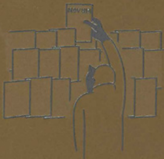
ILLUSTRATION BENEDIKT RUGAR EDITORIAL DESIGN HAGEN VERLEGER GRAPHIC DESIGN MILCH+HONIG