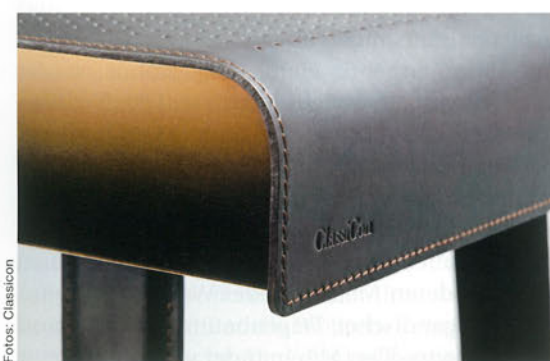
Eine feine Lochung belüftet die darunter versteauten Geräte