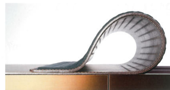
Einglassene Magnete sorgen in jeder Position für eine satte Auflage der Schreibfläche