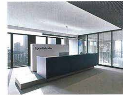
Der Eingangsbereich von Egon Zehnder International, einer international agierenden Personalberatungsagentur: Hier ist Diskretion gefragt – so gibt es für Gespräche, die parallel laufen, auch getrennte Wartebereiche ohne Sichtbezug