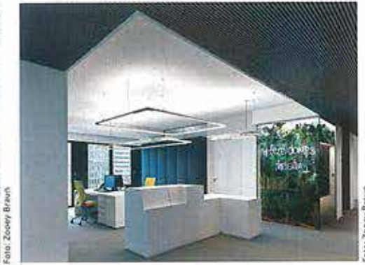
Der Empfang bei Phoenix Real Estate: Die weiße Möblierung kontrastiert mit den dunklen Deckenlamellen des Flurbereichs und den mit Kunstleder gepolsterten Schranktüren, die akustisch wirksam sind

Der zehngeschossige Bürobau eröffnete Anfang der 1990er-Jahre als sogenanntes „Lahmeyer-Haus“. Wie viele Gebäude aus jener Zeit war es aufgrund der gestiegenen Ansprüche der Mieter und dem übersättigten Angebot auf dem Frankfurter Immobilienmarkt im Wettbewerb um die Büroflächenvermarktung nicht mehr konkurrenzfähig. Das Gebäude stand mehrere Jahre leer, bevor sich der Projektentwickler Phoenix Real Estate aufgrund der attraktiven Lage im Frankfurter Westend zu einer vollständigen Entkernung mit anschließender Revitalisierung entschloss.