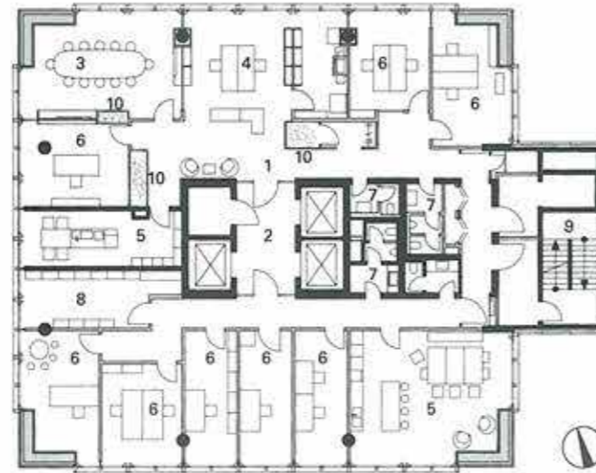
Grundriss nach Sanierung, M 1:333 1/3