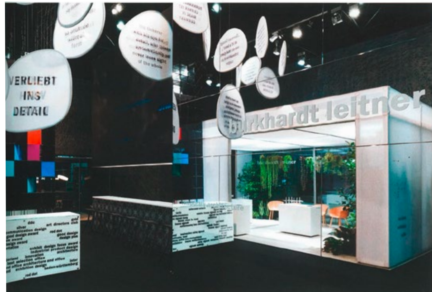
Size 182 m 2 | Exhibitor Burkhardt Leitner constructiv GmbH & Co. KG | Architecture/Design Ippolito Fleitz Group – Identity Architects | Construction format - Atelier für Messe + Design GmbH, Nellmersbach