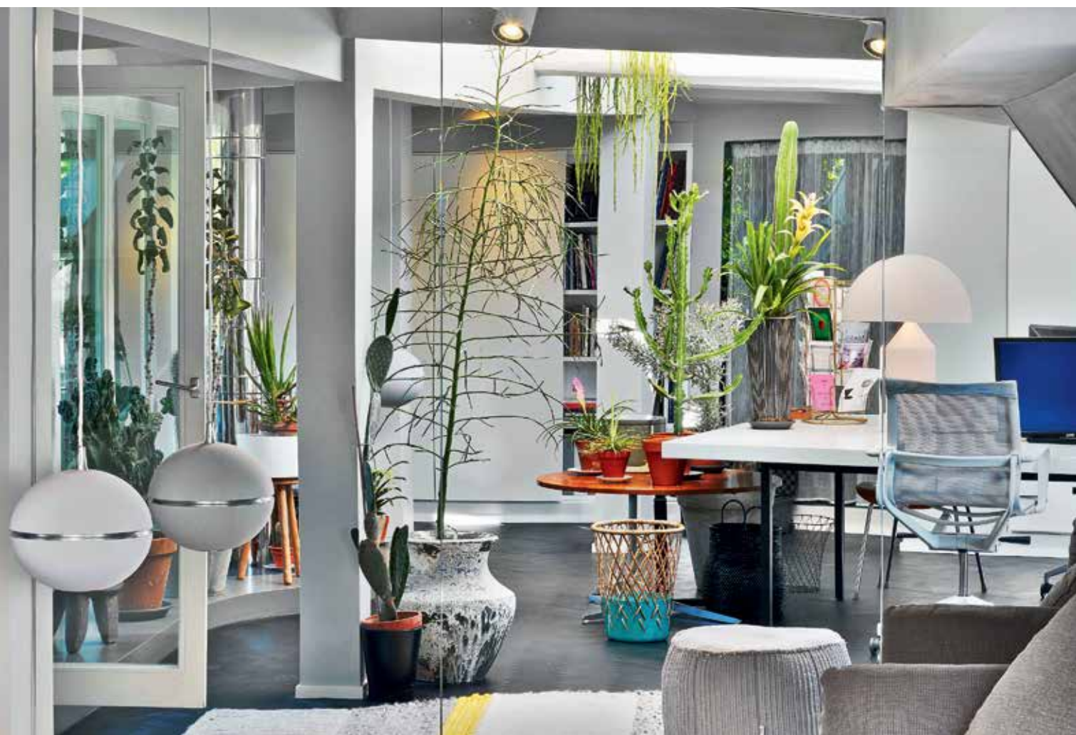
Почти всю мансарду занимает кабинет. Лампа Atollo, диз. Вико Маджистретти, Oluce. Справа: Обои ручной работы Timorous Beasties превращают холл в джунгли. Светильники, диз. Томас Эйк, свисают подобно лианам. В асимметричном проеме видна гостиная с диваном de Sede. Ковер ручной работы Монка, стул Hay. The upper storey houses a spacious study. Oluce's Atollo Lamp. On the right: The walls are decorated with the hand-printed wallpaper by Timorous Beasties. The cut-out in the wall forms an irregular shaped frame for the view onto the living room and de Sede's modular sofa. The handcrafted carpet by Monka.

настроения, краски и самые непредсказуемые предметы: сувениры, привезенные из экзотических поездок, предметы высокого дизайна, любовно собранные произведения искусства. Узбекский икат, лаосские вышивки, индийский деревянный конь в натуральную величину уживаются с работами Дональда Джадда и Ричарда Серра, мебелью Уоррена Платнера, дизайн-группы Front и Патрисии Уркиолы. Проект Maisonette P155 (такое название дали ему авторы) оказался столь удачным, что был удостоен награды iF Design Award 2017 в категории «Жилые квартиры и дома».