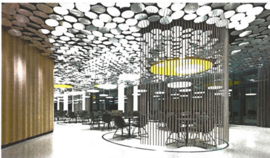
4300 Alu-„Teller“ spiegeln sich auf dem hellen Terrazzoboden und reflektieren ihrerseits das helle Tageslicht. (ZB)