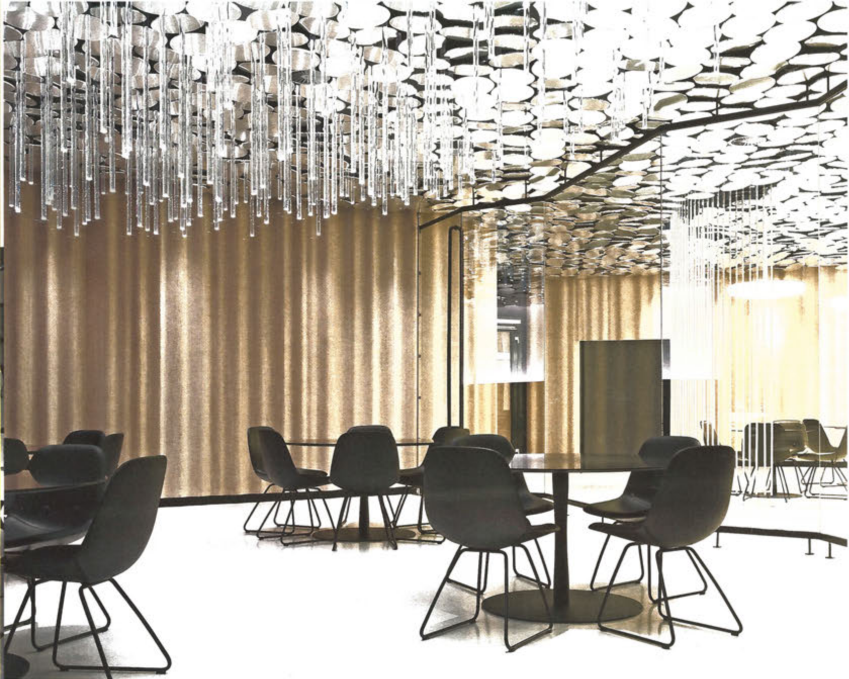
Sonderinstallation: 243 polierte Acryl-Stalaktiten wachsen von der Decke herab und definieren einen Bereich, der abgetrennt werden kann. (o: ZB, re: MT)