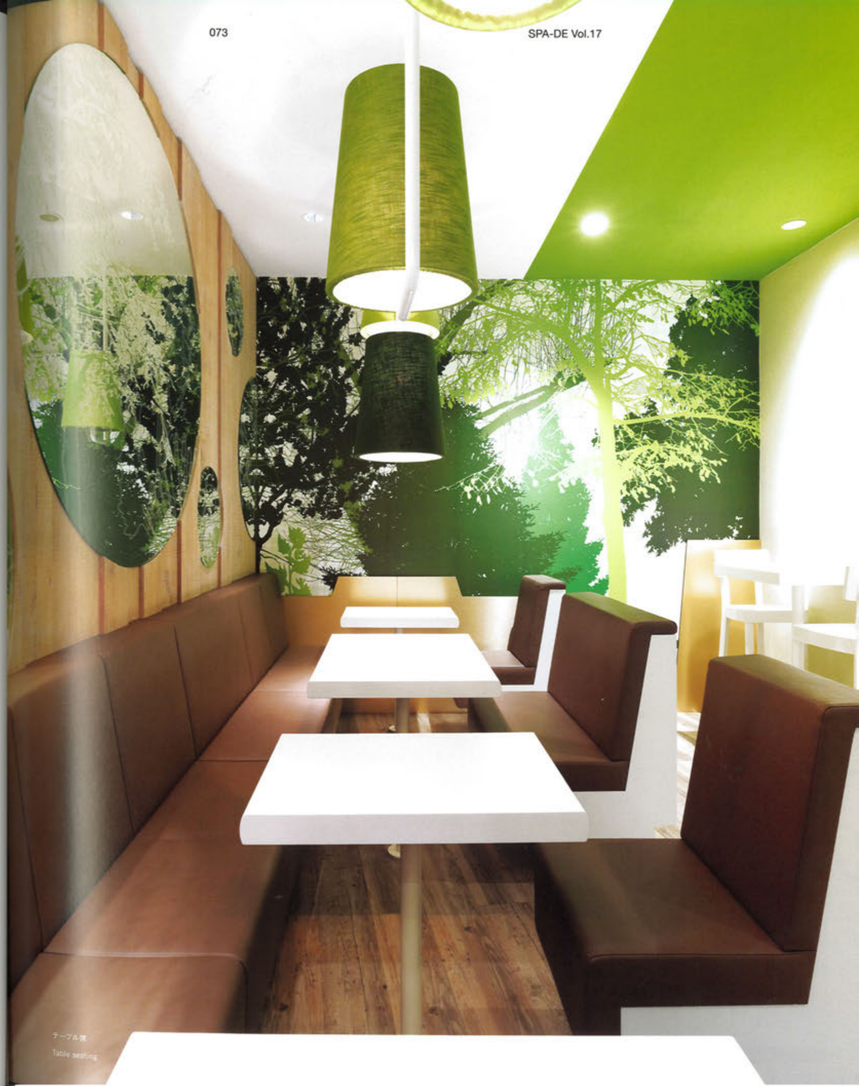
テーブル席 Table seating