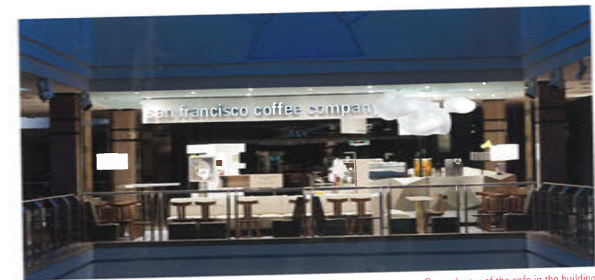
General view of the cafe in the building