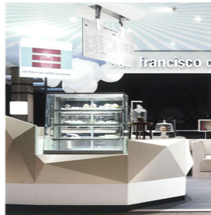
View of the geometric coffee counter