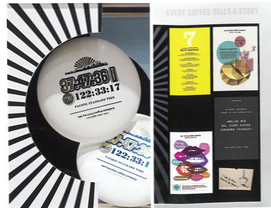
Decorative item on shelf