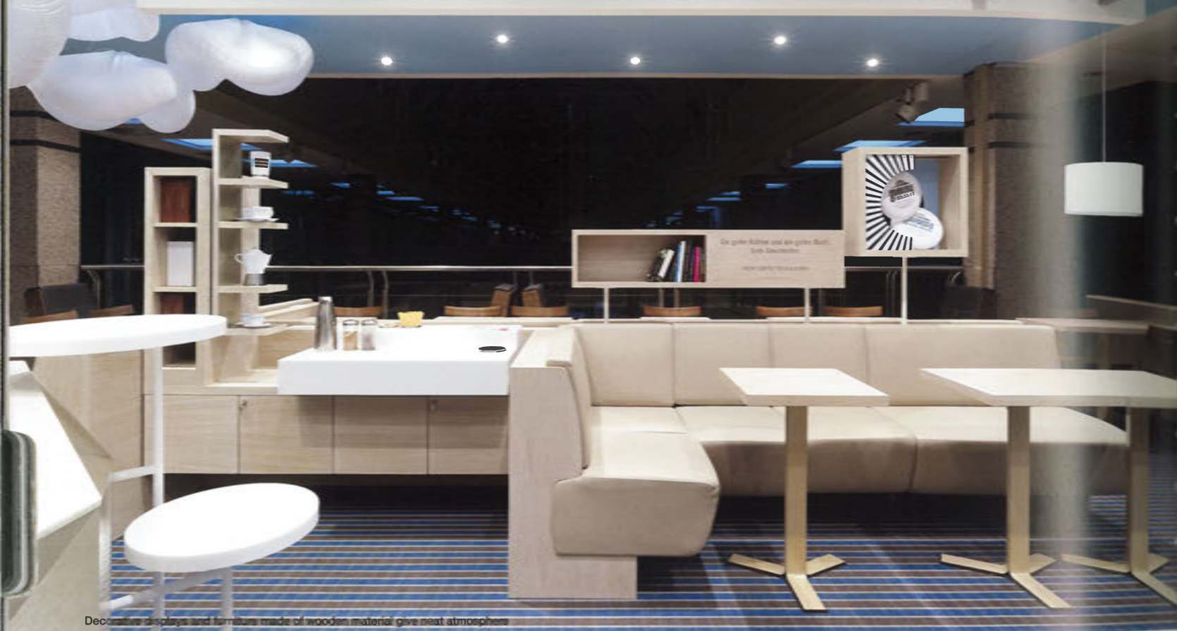
Decorative displays and furniture made of wooden material give neat atmosphere