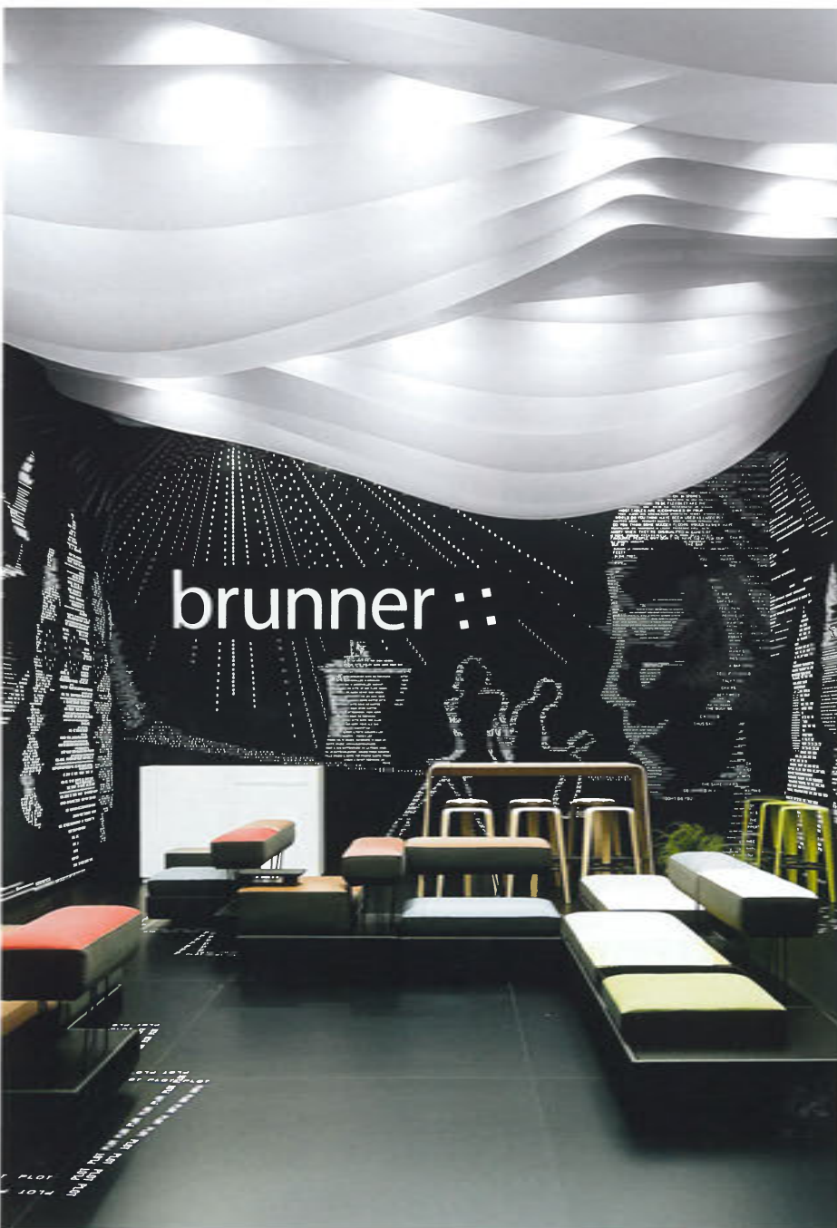
Buchstabenbilder rahmen die Sitzlandschaft von Brunner ein. | The images frame the seating landscape by Brunner.

Entwurf | Design: Ippolito Fleitz Group, Stuttgart