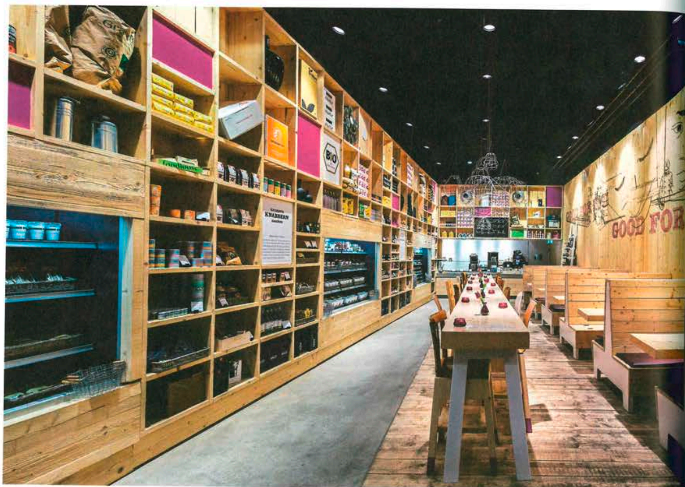
HAMBURG WAKU WAKU

Conjuguer fast-food et bio, tel est le credo de Waku Waku qui a d'abord appliqué ce responsable précepte à son changement de décor et demandé à l'ippolito Fleitz Group de plancher sur le sujet. Résultat : un espace en longueur entièrement aménagé dans un solide pin non traité, tant pour les compartiments de produits que pour l'interminable table d'hôtes au milieu, les boxes en petit comité sur le côté et les sièges reconstruits à partir d'anciennes chaises, clin d'œil à l'esprit de recyclage du concept.