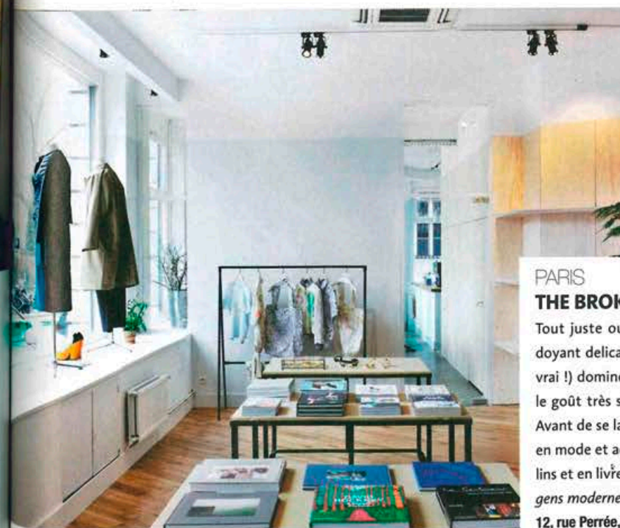
PARIS THE BROKEN ARM

256, rue Saint-Honoré, 75008 Paris. www.aesop.com